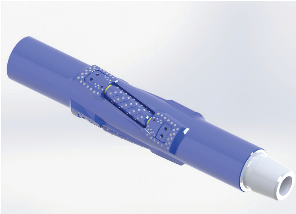
Рис. 4. Шарошечный калибратор ООО НПП «БУРИНТЕХ» со спиральным расположением шарошек

естественный износ твердосплавных зубков, характеризующий их работу в стволе скважины.