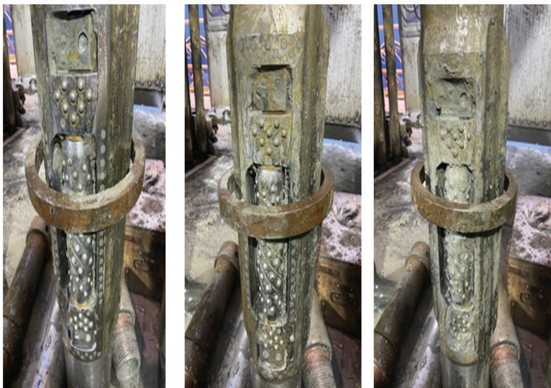
Рис. 3. Внешний вид шарошечного калибратора KP2 после подъема

скважины при прохождении интервалов неустойчивых глин, склонных к набуханию [3]. Компания «БУРИНТЕХ» предложила комплексное решение, включающее в себя предварительное моделирование различных вариантов КНБК в совокупности с применением шарошечного калибратора KP2 (рис. 1). Для проведения анализа и оценки эффективности данных решений, достигнутые результаты при бурении скважин с KP2 сравнивались с показателями бурения скважин схожего профиля того же куста, пробуренными без применения калибратора KP2.